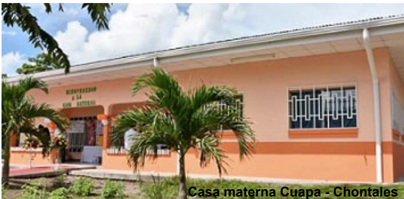
Casa materna Cuapa - Chontales