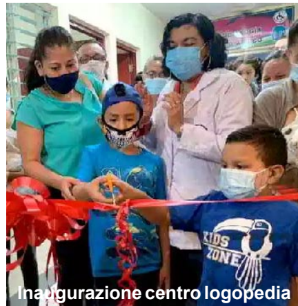
Inaugurazione centro logopedia