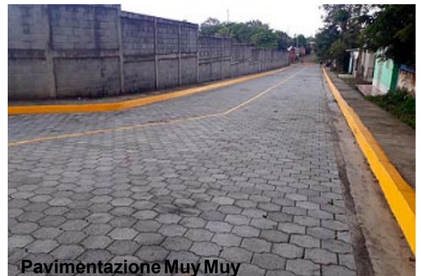
Pavimentación Muy Muy